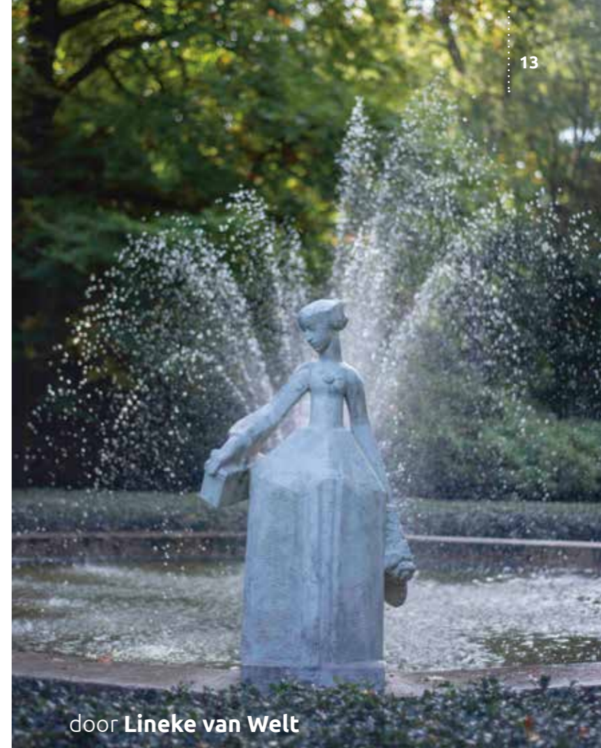
door Lineke van Welt

Langzamerhand waren wij elkaar kwijtgeraakt. We kregen kinderen, verhuisden naar andere oorden en werden in beslag genomen door 'hard werken' en druk-druk-druk. En dat terwijl we lief en leed deelden, destijds in onze 30+-groep. Is dat alweer twintig jaar geleden? Het voelt nog zo dichtbij... Elke maand kwamen we samen, maakten we tijd om elkaar te ontmoeten, met elkaar te eten, elkaar te inspireren en met elkaar 'op weg te gaan'. Door het delen van het Gewone creëerden we ruimte voor het Bijzondere .